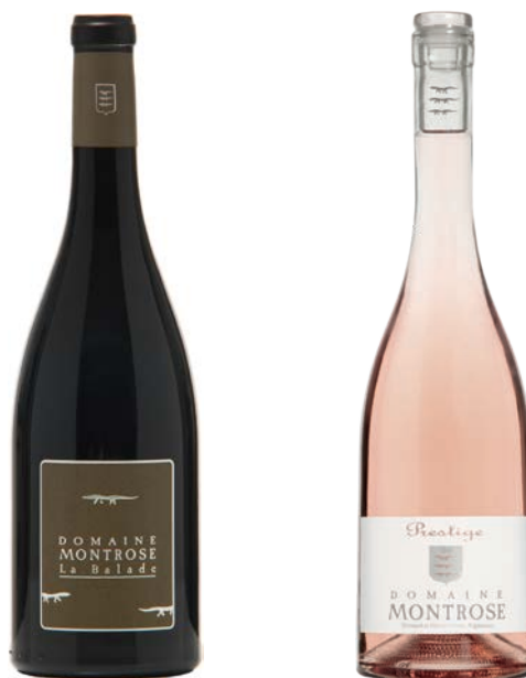
LA BALADE PRESTIGE