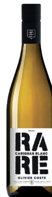
Rare, CARIGNAN BLANC

Le Carignan noir est un grand cépage méditerranéen. Nous en tirons la quintessence en limitant sa production par un terroir caillouteux et une taille en gobelet. Il livre alors un vin riche, aux notes de fruits noirs et d'épices, tout en fraîcheur.