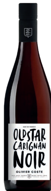
Old Star, CARIGNAN NOIR

Utilisé pour teinter les mauvais vins d'ici et d'ailleurs, l'Alicante Bouschet fit la fortune des vignerons locaux... Pourtant, conduit en gobelet traditionnel sur un terroir adapté, il donne de beaux vins fruités aux notes torrifiées.